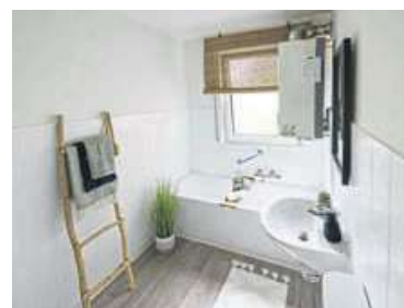
Aus einem dunklen Bad zaubert die Unternehmerin eine Wohlfühllose – ohne Hokusfokus, dafür mit dekorativen Accessoires, die Wohnräume wecken.