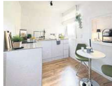
Stilsicher richtet Iris Linker jeden Raum ein. So wird aus einer kahlen eine gemütliche und funktionelle Küche.